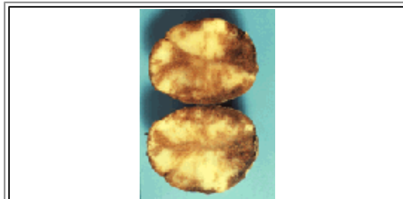
Die Knollen von Kartoffeln, die von dem Pilz befallen sind, sind ungenießbar.

Die akute Infektionsgefahr läßt sich anhand regelmäßig ermittelter Werte der Lufttemperatur, der relativen Luftfeuchte und des Niederschlags feststellen. Dabei spielt das Auflaufdatum (das Erscheinen der ersten Blätter) eine wichtige Rolle. Im Abstand von 10 - 20 Tagen spritzt der Landwirt dann den Kartoffelbestand vorbeugend mit wechselnden Präparaten. Dadurch versucht er, die Entwicklung von Resistenzen des Pilzes gegen einzelne Fungizidwirkstoffe zu unterbinden. Denn Resistenzen von Kulturpflanzen gegen die Wirkstoffe häufig eingesetzter Pflanzenbehandlungsmittel treten in den letzten Jahren verstärkt auf. Sie erschweren eine wirkungsvolle Bekämpfung des Schaderregers.