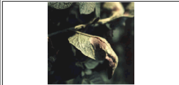
Phytophthora infestans kann die gesamte Pflanze - hier ein infiziertes Blatt - befallen.

Die Züchtung auf Widerstandsfähigkeit (Resistenzzüchtung) gegen diesen wichtigen Schaderreger zeigte bislang nur wenig Erfolge. Es gibt sehr viele verschiedene Rassen dieses Pilzes. Die meisten Kartoffelsorten sind jeweils nur gegen bestimmte Rassen widerstandsfähig, gegen andere dagegen anfällig. Bei einigen Sorten ist die Resistenz in Kraut und Knollen auch unterschiedlich stark ausgeprägt. Im praktischen Anbau sollte nur gesundes Pflanzgut Verwendung finden. Befallene Pflanzen müssen sorgfältig beseitigt werden. Sparen am falschen Platz durch die Verwendung infizierter Knollen aus der eigenen Ernte als Pflanzgut kann für den Landwirt fatale Folgen haben. Zum Schutz vor einer epidemischen Ausbreitung der Kraut- und Knollenfäule werden systematische Behandlungen mit synthetischen Bekämpfungsmitteln gegen Schadpilze (Fungizide) durchgeführt. Die Behandlungen erfolgen vorbeugend, zumeist gemäß den Warnmeldungen des Pflanzenschutzdienstes.