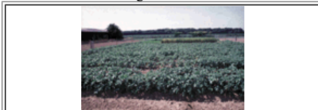
Das Versuchsfeld im Juli 1996 vor der Zerstörung.

Die Wissenschaftler des MPIZ wollen nun prüfen, ob dieses Zwei-Komponenten-System auch unter praxisnahen Bedingungen im Freien einer epidemischen Ausbreitung der Kraut- und Knollenfäule vorbeugen kann.